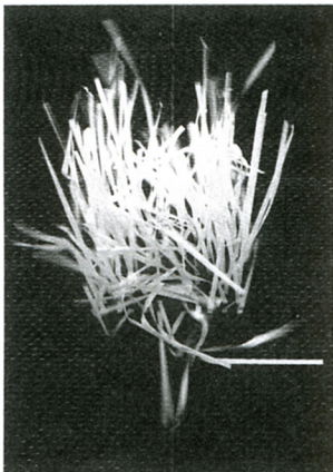
Éric Daudelin 1/Marilyn (detail) , 2001 Impression numérique 76 cm x 56 cm