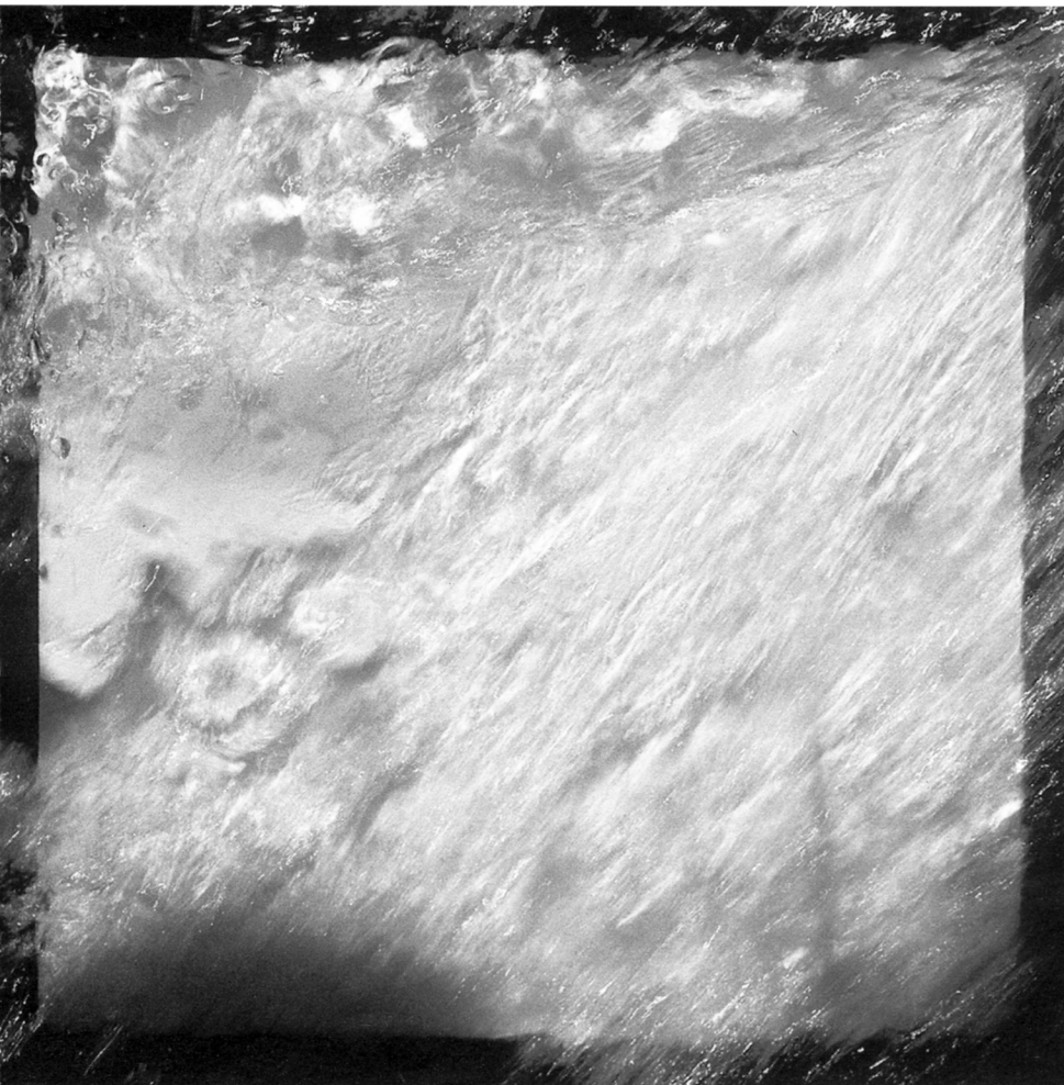
Interférence N° 20, 1999 57 x 38 cm (Figure 1)